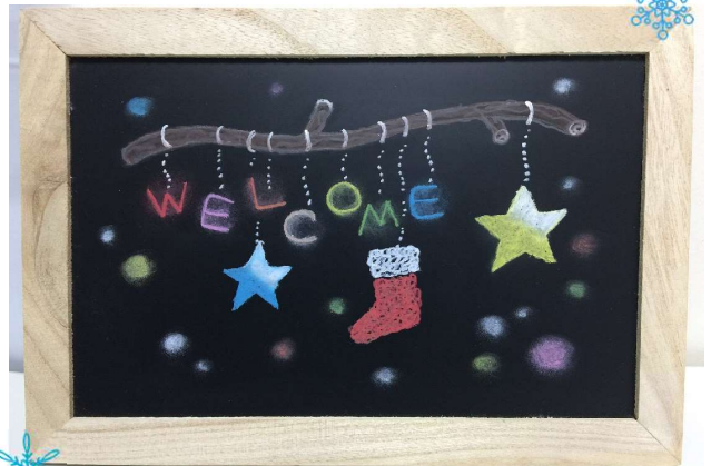
デザインは変更になる場合がございます