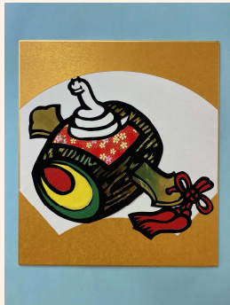
(A: 打ち出の小槌と巳)

申込方法： 下記の二つの作品から作成したい方をいずれか一つ各自希望(AかB)の上でお申し込み下さい。