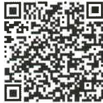
すすき野地域ケアプラザ 申込QR