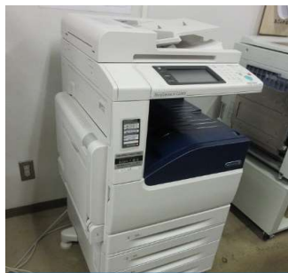
5.31 カラーコピー機（共用）

～昨年度も、利用料金収入の1/3相当の金額を、皆様の日々のご活動やご利用が少しでも便利になるように、修繕の実施や備品の購入に充てさせていただきました。その中の一部をご紹介します。～