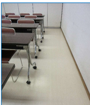
12.17 床張替工事（会議室3B）