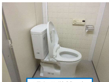
1.7 トイレ洋式化工事 （3階男女各1ヶ所）

皆様からいただいた 利用料金を、大事に使わ せていただきます。 今後ご意見・ご要望等 お聞かせください。