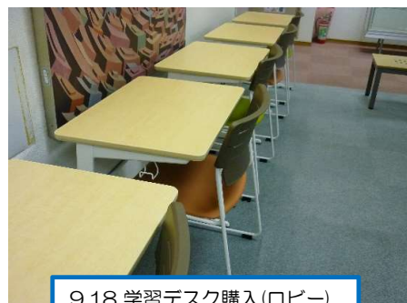
9.18 学習デスク購入（ロビー）