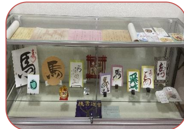
ロビーガラスケース展示