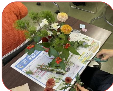
お正月お花 フラワーアレンジメント