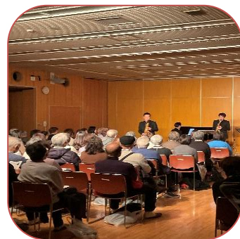
コンサート・キャラバン 龍トリオ～サクソフォン&ピアノ～