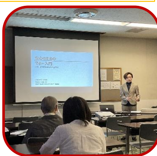
くらしとお金 安心のためのマネー入門